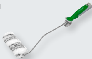
softTouch Plüschroller doppelstark

Die nachfolgende Tabelle stellt alle Einzelprodukte übersichtlich vor, zeigt Ihnen die speziellen Anwendungsbereiche, Qualitätsvorteile und Verarbeitungshinweise.