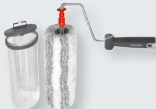
RollMatic® Fassadenroller mit Klicksystem