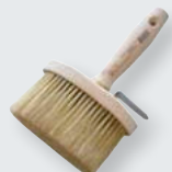
Fassadenstreichbürste oval FSC® zertifiziert