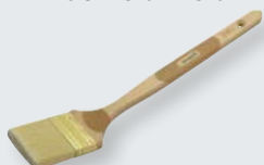
LaserTouch® Fassadenpinsel FSC® zertifiziert