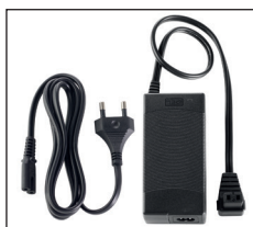
Netzteil für die Steckdose