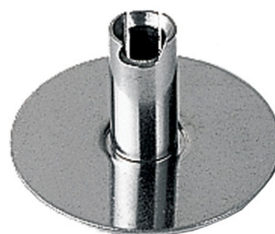
Schlagscheibe Für alle wichtigen und schwingigen Speisen. Schlagschnecke, Soufflés, Sahne...

ESGE Zauberstab Schlagscheibe 7010. Zubehörtyp: Mixerschläger, Produktfarbe: Silber, Material: Edelstahl. Breite: 35 mm, Tiefe: 35 mm, Höhe: 20 mm. Menge pro Packung: 1 Stück(e). Gewicht der Papierverpackung: 6 g, Gewicht der Plastikverpackung: 2 g, Verpackungsbreite: 110 mm. Länge des Versandkartons: 127 mm, Höhe des Versandkartons: 132 mm, Gewicht Versandkarton: 141 g