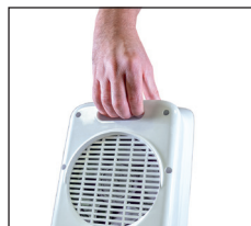
Praktischer Tragegriff im Gehäuse