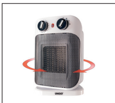
70° oszillierend zur besseren Luftverteilung