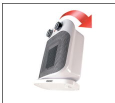
Kipp-Schutz/Auto off = Sicherheitsabschaltung