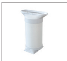
Abluftrohr zum Ableiten der heißen Luft