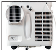
Restwasserauslässe auf der Rückseite