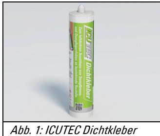
Abb. 1: ICUTEC Dichtkleber