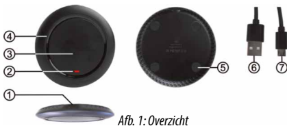
Afb. 1: Overzicht