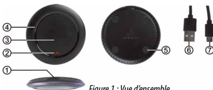
Figure 1 : Vue d'ensemble