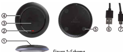
Figura 1: Schema