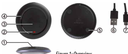
Figure 1: Overview