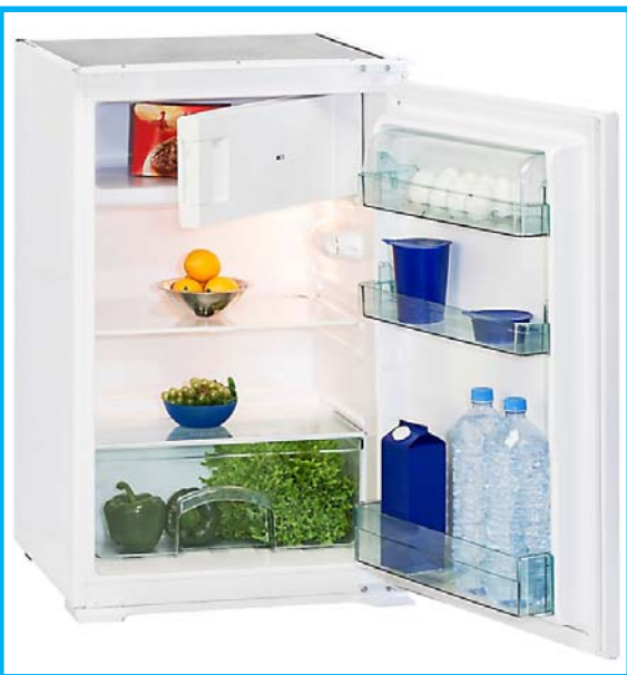
EKS 131-4 A++