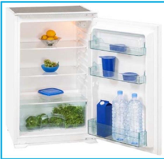
EKS 131-4 RVA++