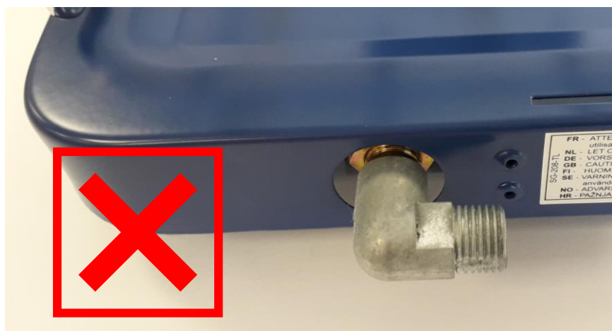
Silberfarbener, rechtwinkliger Anschluss