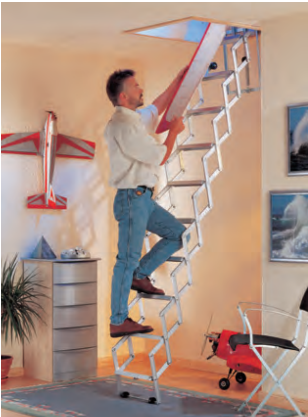
DOLLE alu-fix mit Stirnbrett