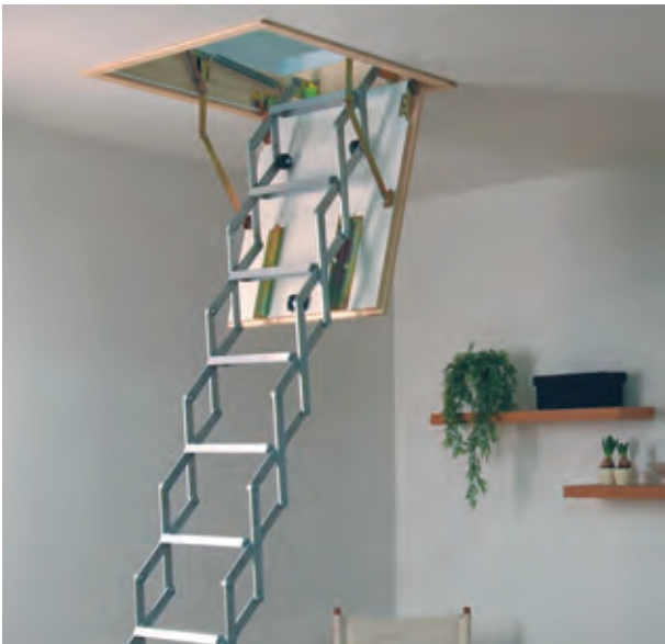
DOLLE alu-fix mit Lukenkasten