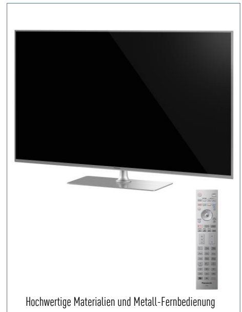
Hochwertige Materialien und Metall-Fernbedienung