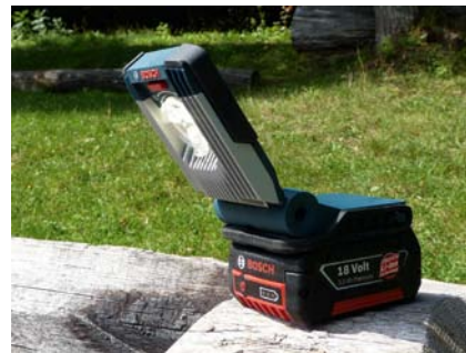
Wenn es mal wieder länger dauert: Die „GLI Vari LED Pro“ liefert mit Fokussier-/Streuscheibe entweder einen scharfen Lichtkegel oder eine diffuse Ausleuchtung des Arbeitsbereiches.

Eine wahre Freude ist das Glätten der Flächen mit dem Hobel „GH0 18 V-LI Professional“! Dieser wiegt nur 2,6 kg – inklusive robuster Aluminiumsohle. Die Spandicke kann stufenlos bis 1,6 mm eingestellt werden und ein einzelnes „Woodrazor“-Wendemesser nimmt das Holz sauber ab. Leider ist nach rund 15