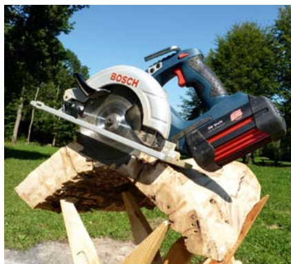
Lange Leistung: Die Handkreissäge „GKS 36 V-LI Professional“ soll mit einer 2,6-Ah-Akkuladung bis zu 85 m in Spanplatte laufen – nachweislich zerteilte sie das ringschalige Eichenstück von über 50 mm Dicke.

An einem Sommertag im Freien ist es kein Thema – aber wenn es mal wieder länger dauert, oder in den letzten Winkel des Einbauschranks geht, muss entsprechende Beleuchtung her. Warum also nicht gleich eine Lampe nutzen, die zum Akkusystem passt?! Für das Arbeitslicht „GLI Vari-LED Professional“ findet sich in jeder Tasche noch ein Plätzchen und irgendein Akku aus der 14- oder 18-Volt-LI-Serie wird auch noch genügend Restspannung haben, um die 300 Lux der drei Power-LEDs zu aktivieren. Für eine einzelne Schraube oder einen kurzen Sägeschnitt ist dies übri-