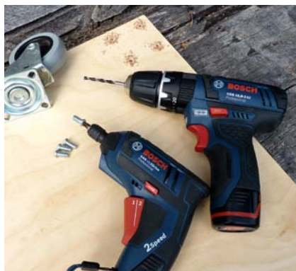
Starkes Team: Während der kräftige „GSB 10,8-2-LI Professional“ präzise Löcher bohrt (auf Wunsch sogar mit Schlag) zieht der kleine „GSR Mx2Drive Professional“ konsequent alle Schrauben fest.