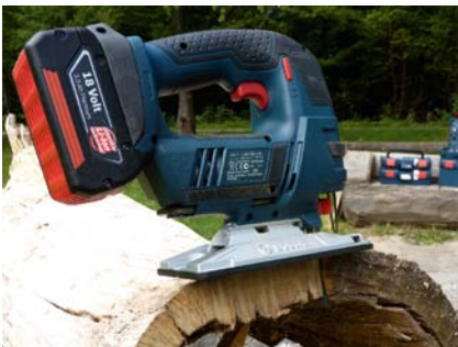
Keine Angst vor Herausforderungen: Schnitte in massivem Eichenholz sind für die „GST 18 V-LI Professional“ der „Dynamicseries“ von Bosch kein Problem.

„Bosch Blau“ ist für den professionellen Dauereinsatz im Handwerk ausgelegt – d. h. robuste Getriebe, stabile Gehäuse, lange Anschlusskabel und vieles mehr, auf das der Profi großen Wert legt. Das gilt natürlich auch für Akkumaschinen. Doch was können diese wirklich? Wir haben einmal willkürlich in das Sortiment gegriffen, von jeder Gattung eine Maschine herausgenommen, alles ordentlich in „L-Boxxen“ in den Transporter gepackt und sind in den Schönbuch gefahren. Der Naturpark Schönbuch ist ein überwiegend von Buchen und Eichen geprägtes Wald- und Erholungsgebiet im Süden von Stuttgart. Hier gibt es zahlreiche Grill- und Sportplätze fernab jeglicher Behausung. Kurz: Das ideale Terrain für unseren Praxistest. Erprobt werden sollen die Maschinen, überwiegend Neuheiten und allesamt mit Lithium-Ionen-Akkus ausgestattet, an einem soliden Stück Eiche. Durch Pilzbefall kam es bei dem etwa 1 m langen Stammabschnitt zu einem Ringriss, so dass der Kern bereits herausgelöst war. Nach einer längeren, sanften Trocknungsphase wurde nun zunächst außen