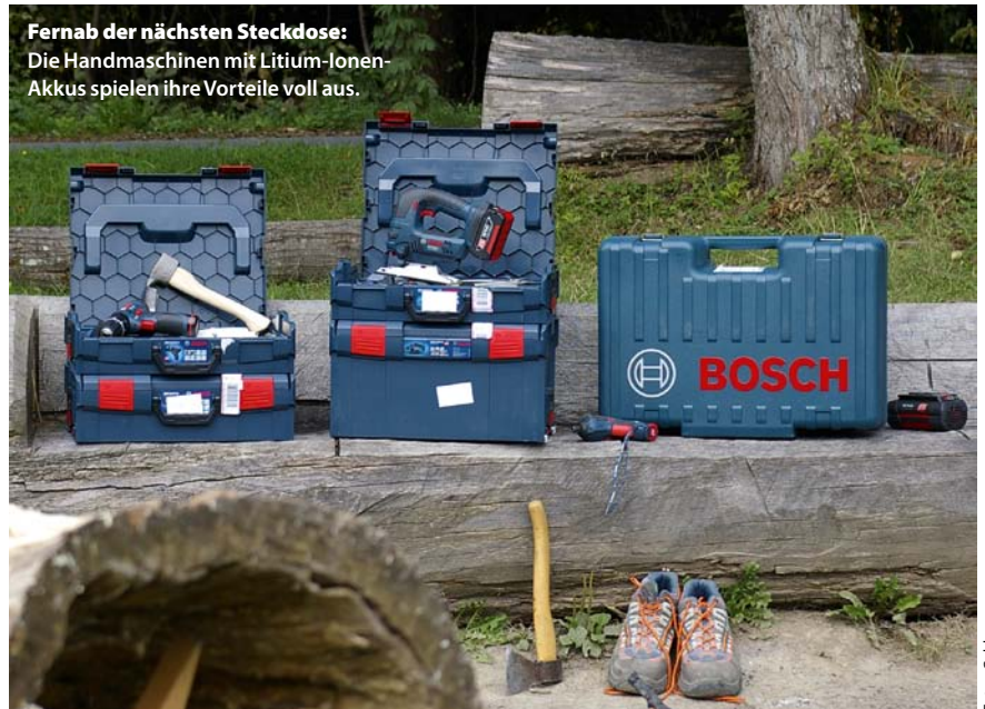
Fernab der nächsten Steckdose: Die Handmaschinen mit Lithium-Ionen-Akkus spielen ihre Vorteile voll aus.