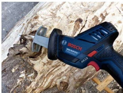
Empfohlene Schnitttiefe: 65 mm in Massivholz bewältigt die kompakte Säbelsäge „GSA 10,8 V-LI Professional“ spielend, wie hier beim Entfernen eines Astes.

V-LI Professional“ maximal 65 mm empfohlen – genau richtig, um einen überstehenden Astansatz zu egalisieren. Das kompakte Gerät lässt sich mühelos mit einer Hand führen, der Sägeblattwechsel erfolgt schnell mit dem Bosch-SDS-System. Insbesondere bei den Geräten der niedrigen Voltklasse macht sich scharfes Werkzeug bezahlt – die „GSA 10,8 V-LI Professional“ wird mit einem Sägeblatt für Holz und Metall sowie mit einem reinen Metallblatt ausgeliefert.