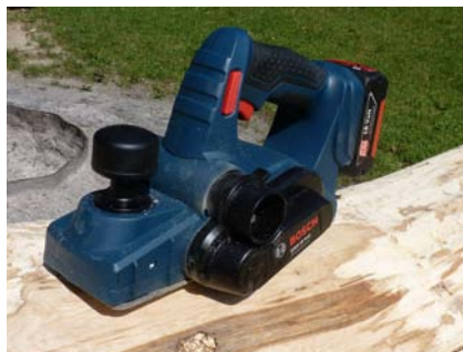
Entspannendes Arbeiten: Der Akku-Hobel „GH0 18 V-LI Professional“ arbeitet mit einem einfach zu wechselnden und verschleißfesten „Woodrazor“-Wendemesser.

Der kleine „GOP 10,8 V-LI Professional“ liegt mit seiner ausgewogenen Gestaltung und ergonomischem Softgripp gut in der Hand – Dank seines Gewichtes von lediglich 1 kg auch bei Arbeiten „am langen Arm“ oder über Kopf. Aber er hat seine Grenzen: Für ausgeprägte Tauchschnitte in Massivholz reicht seine Leistung ebenso wenig wie die wenig aggressive Zahnung des Standard-Sägeblattes. Angenehm sind Schleifarbeiten – aber sind wir ehrlich: Ihn lediglich als Delta-