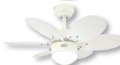
Colors of Young Generation/ Colors of Youth, weiß/Ahorn