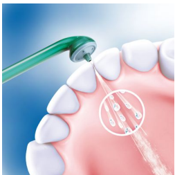
Kombination aus Luft und Mikrotröpfchen