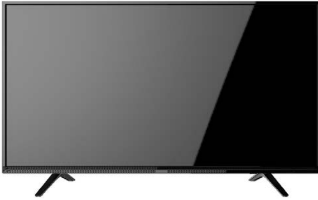
Non-smart TV, HD