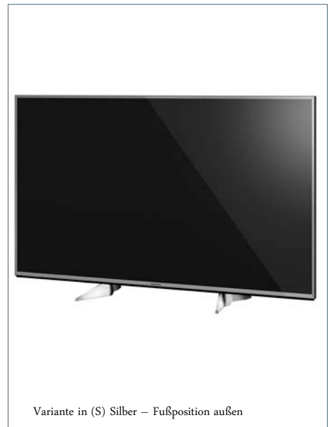
Variante in (S) Silber – Fußposition außen

TX-40EXW604 | 40" – 100 cm | EAN 5025232861828 || TX-40EXW604S | 40" – 100 cm | EAN 5025232861835