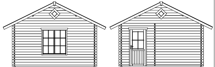
Grundriss, Schnitt und Ansichten M 1:100