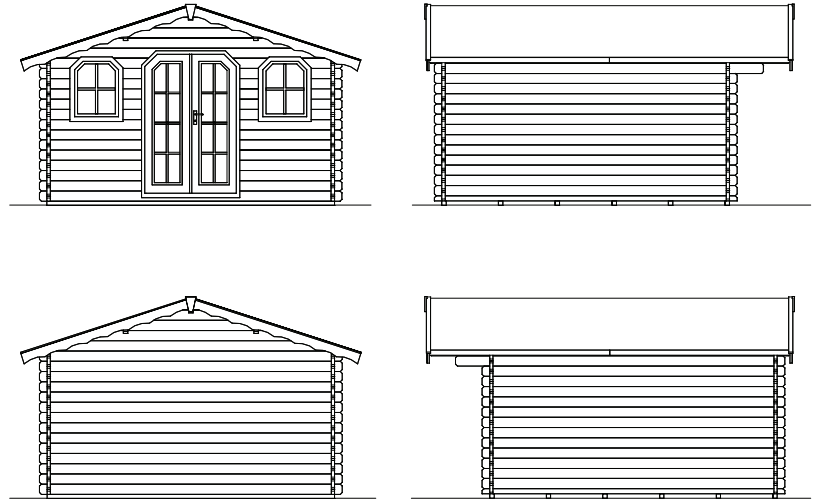
Grundriss, Schnitt und Ansichten M 1:100