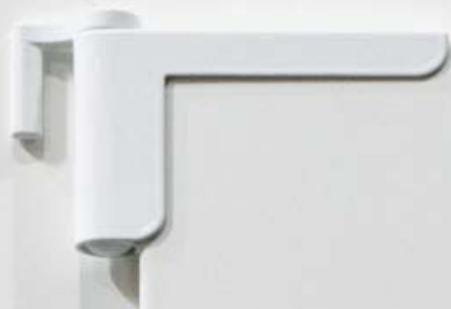
Anwendung bei DIN linker Tür